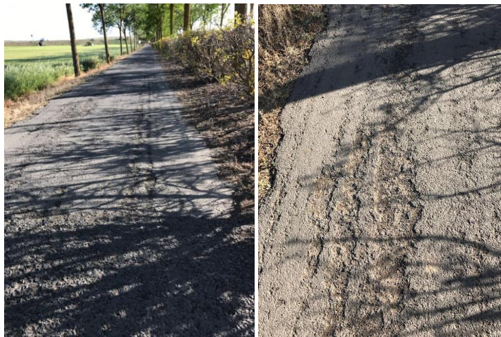
Estado en el que se encuentra la calzada de la Vía Verde

Rodríguez ha denunciado que está aumentando el número de quejas y reclamaciones de los vecinos de Ciudad Real en relación al cuidado y mantenimiento de las zonas verdes de la ciudad. Ha declarado que mientras con el anterior equipo de Gobierno del Partido Popular se obtenían banderas verdes por la ampliación y gestión de dichas zonas, ahora, con Pilar Zamora, las zonas verdes aparecen sucias y descuidadas. Considera que la mala gestión de Zamora y sus concejales está desatendiendo y permitiendo el deterioro de una de las zonas preferidas de las familias de Ciudad Real para pasear o hacer deporte, como es la Vía Verde, que es utilizada a diario por cientos de personas y requiere de una especial atención que no está recibiendo por parte de los socialistas. Ha hecho hincapié en el mal estado del carril bici, lleno de baches y socavones, y exige a Zamora que lo arregle, ya que el buen tiempo hace que se dispare el número de usuarios. "Llevan dos años, ya es hora de que se pongan a trabajar porque nunca la ciudad ha estado tan sucia y abandonada como desde que gobierna Pilar Zamora".